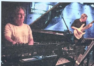
Un momento del concerto di Calderazzo, Patitucci e Weckl