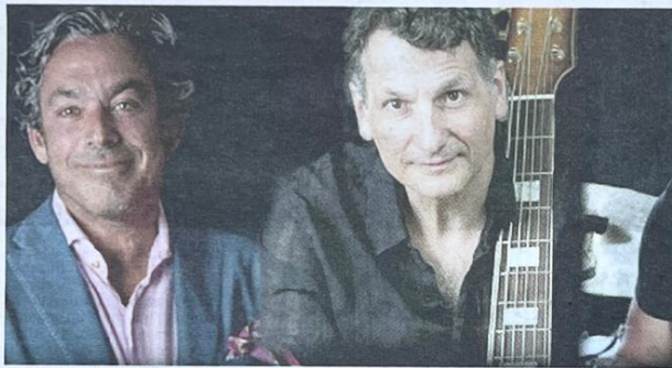
MUSICISTI Il pianista Joey Calderazzo e il chitarrista John Patitucci si esibiranno con Dave Weckl

Non mancheranno concertini nei locali del centro e incontri di approfondimento culturale in città. Grande emozione per il concerto più atteso di questa edizione di Jazzinsieme, in cui i fan avranno occasione di vedere sul palco di piazzetta Calderari (al Capitol in caso di pioggia) il super trio formato da Joey Calderazzo, John Patitucci e Dave Weckl. A partire dalle 21.30, il trio di leggende del jazz salirà sul palco per la tappa pordenonese del primo tour insieme nella loro carriera pluridecennale. Bastano i loro cognomi, rigorosamente in ordine alfabetico, per provare un brivido e fare salire la pelle d'oca agli appassionati. Joey Calderazzo è uno dei migliori pianisti della sua generazione, con alle spalle la pubblicazione di tredici album come leader. Vanta numerose collaborazioni con eccellenze della musica jazz. I gusti eclettici del bassista John Patitucci gli hanno fatto esplorare tutti i generi musicali come musicista e compositore. Le sue sei registrazioni da solista per la Grp Records e le sue incisioni successive gli hanno portato due Grammy Awards e oltre quindici nomination ai Grammy. Dave Weckl è considerato uno dei batteristi jazz/fusion più influenti e tecnicamente dotati di tutti i tempi.