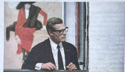
MARCELLO MASTROIANNI RITROVATO sul set di 8½